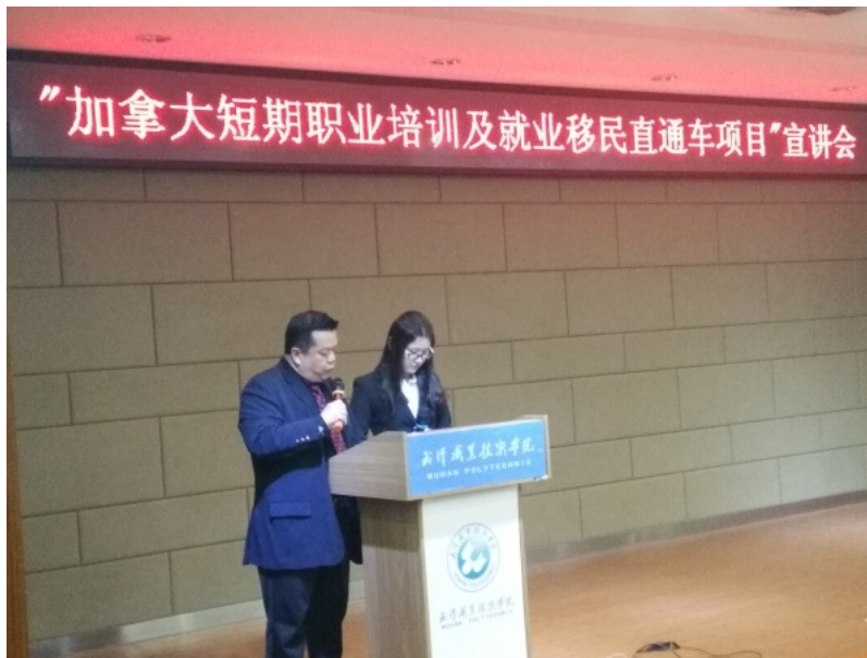
魁北克政府移民和就业指导委员会驻华办事处主任Michel在宣讲会作重要发言

据悉，“加拿大就业移民直通车项目”在宣讲活动之后，将会启动意向学生报名筛选工作，或于五月份开始同魁北克省企业的面试。